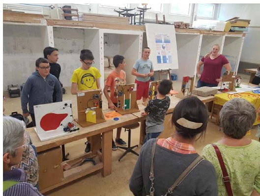
Lors des portes ouvertes du collège Jules Grévy de Poligny dans le cadre du Festival Les Germinales : « comment éduquer autrement la jeunesse ? »

Ajena était présente à travers un stand « Faire » aux côtés des Répar'Acteurs, d'Alternative solaire du Haut Jura, des centrales villageoises, du Rézo Pouce PAS, des ateliers de réparation de vélo, etc... Bravo et merci aux organisateurs !